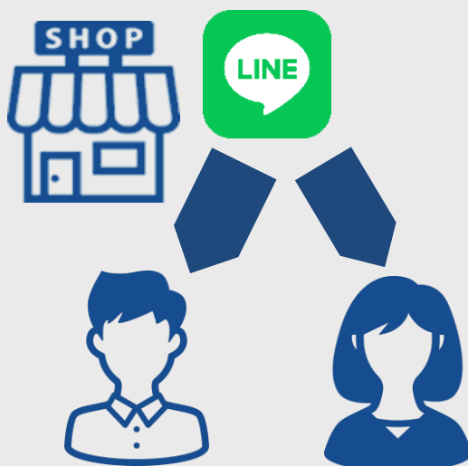
実際の速報LINEイメージ